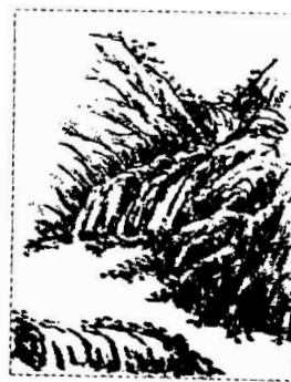
■文/杨纯(和平村一社区)

流水至断壁悬崖处则飞流直下即瀑布,行经山间低洼处,浮土随之冲走,剩下的是岩石。所以流向左右冲突,忽宽忽窄。画泉有一叠、两叠、三叠、多叠等,随山势而变化。