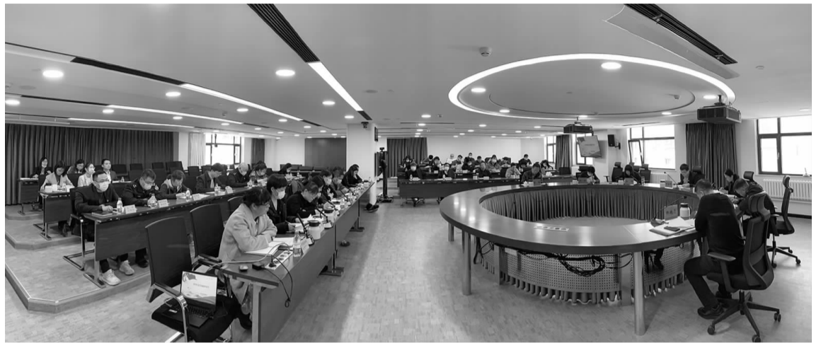
双井街道召开2022年3月工作总结会