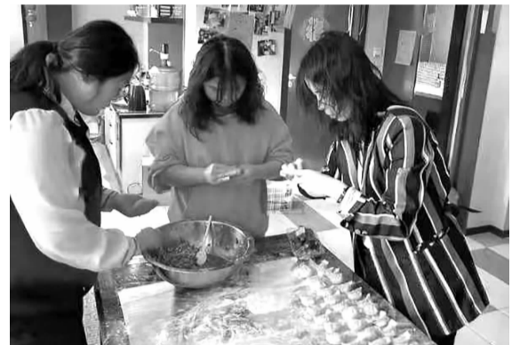
春节期间大家一起包饺子