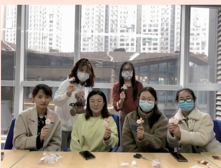
大家一起展示自己的作品