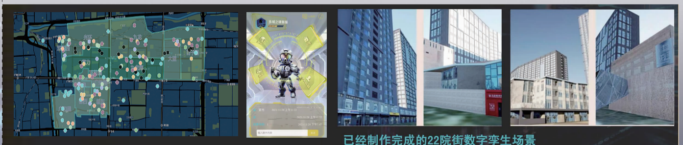
已经制作完成的22院街数字孪生场景

推动数字化社区“生活圈”和数字经济“营商圈”双圈联动,以“一刻钟服务圈”为时空范围,构建数字小区看板,基于人口特征、小区品质、社区事件及服务统计等数据,形成双井各小区的基本特征画像,实现数字经济圈“最后一公里”服务底座。建立场景地图,实现“线上+线下”社区生活服务新业态打造。