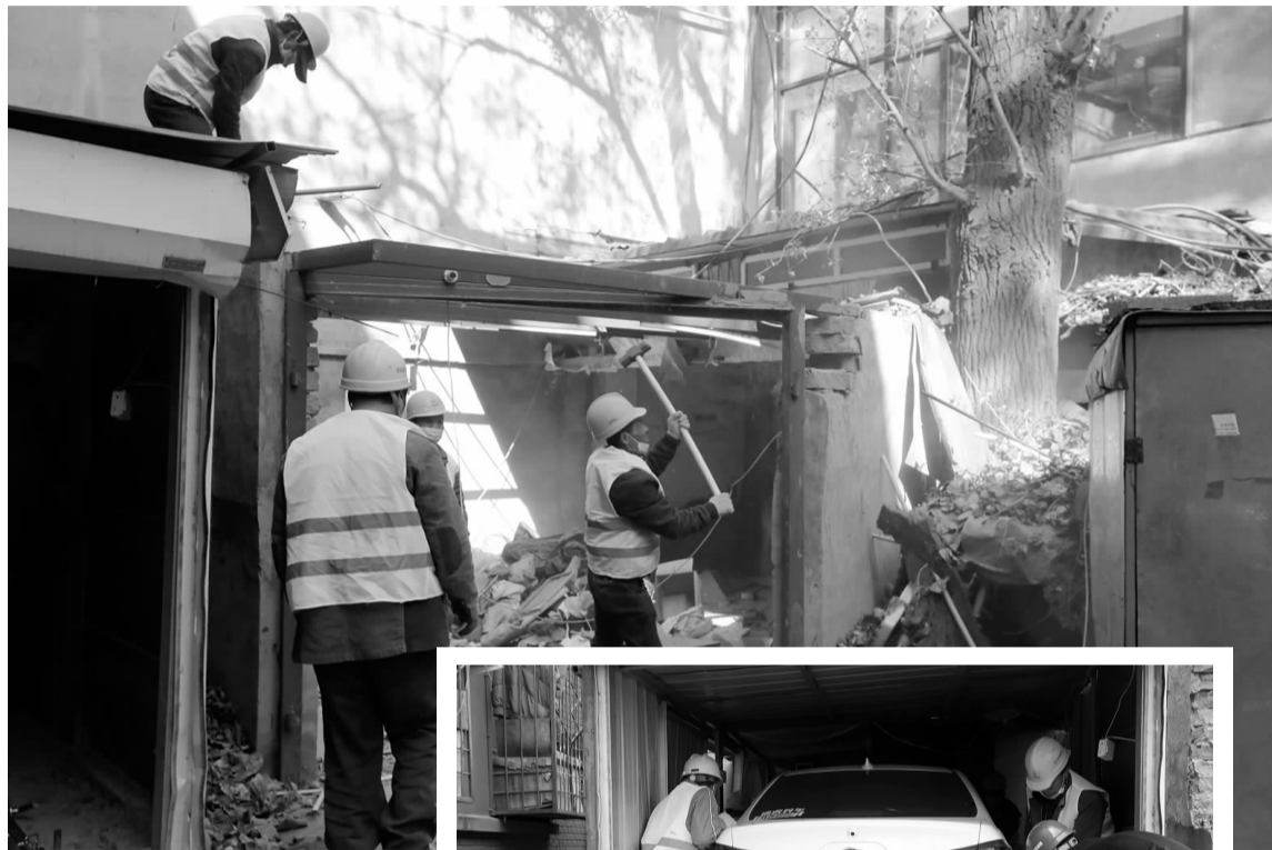
▲ 工人对违法建筑进行拆除