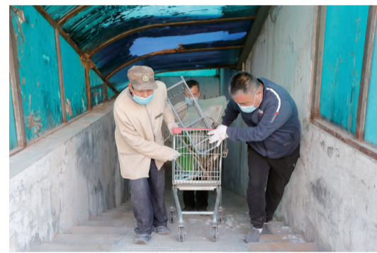
工作人员清理堆积物品

本次集中清理行动不仅净化了小区内的公共空间,确保消防通道的畅通,还提高了小区物业服务水平和辖区居民参与社区治理行动的积极性。接下来,社区还将形成清理整治的长效机制,通过“系统化宣传”、“不定期巡查”、“常态化清理”等工作措施,提升城市形象,提高居民的幸福感和获得感。