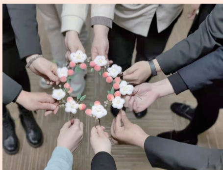
制作好的绒花作品

此次活动得到参与者的一致好评,不仅了解到一项中国传统的手工艺,还完成了亲手制作的绒花作品。看到大家满意的笑容,就是对活动最好的满意度调查。同时也为2022年继续在“两新”组织领域因地制宜、形式多样地建立妇女组织阵地,起到重要作用。