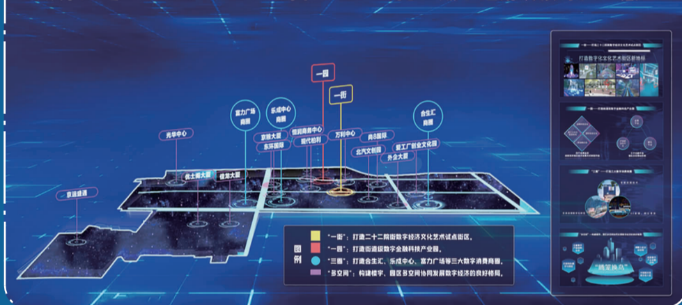
双井街道“一街、一园、三商圈、多空间”数字经济发展布局示意图