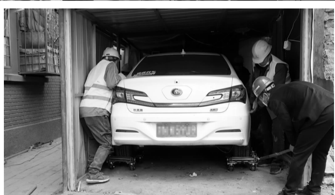
▶ 工人通过手动移车器将汽车推出车库