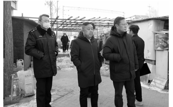
双井街道领导检查老旧小区改造及铁路沿线环境